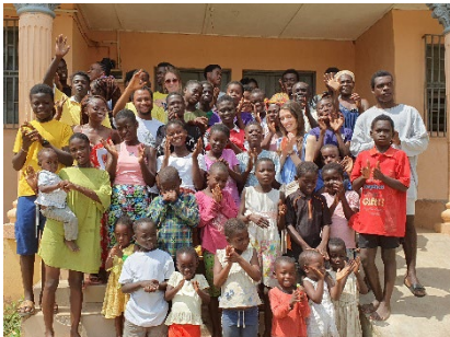
Im Projekt dauerhaft lebende Kinder