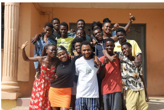
Unsere jungen Erwachsenen in Tertiärbildung

Neben den 15 Jugendlichen in Tertiärbildung werden die nächsten zwei Jahre noch 10 weitere die Senior High School abschließen, und somit eine Ausbildung oder ein Studium starten. Wir wissen also jetzt schon, dass wir mindestens die nächsten fünf bis sechs Jahre relativ hohe laufende Bildungskosten haben werden. Für unsere finanzielle Planung die nächsten Jahre heißt das: Keine