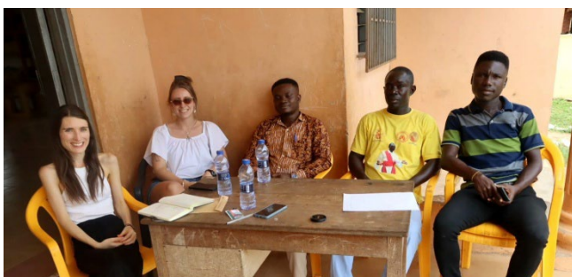
Treffen mit Mr. Nana von der Gesundheitsbehörde

Ein weiteres Highlight der Reise: Wir haben uns mit dem für unsere Region